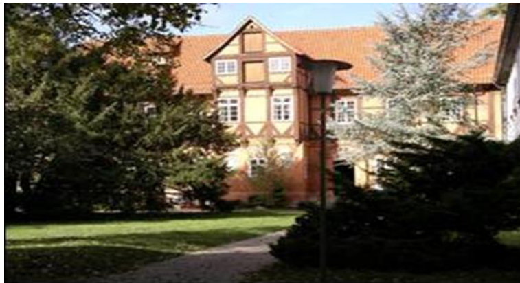
Unterbringung und Verpflegung in der Europäischen Akademie Bad Bevensen

Anreise Freitag um 14.00 Uhr Seminarbeginn um 15.00 Uhr. Seminarende Sonntag um 12.00Uhr.